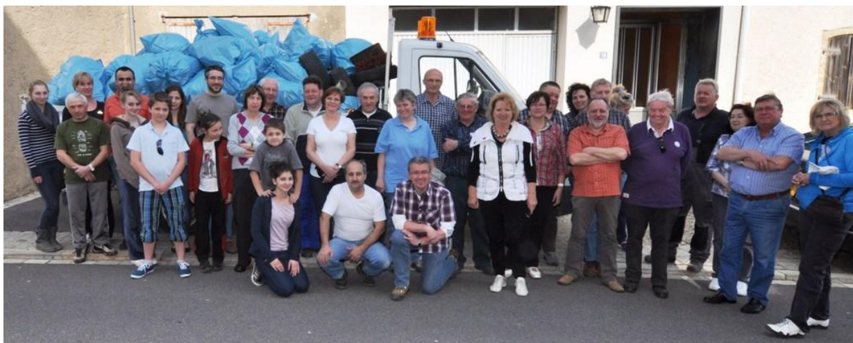
Fréijoersbotz 2012 an der Gemeng Wormer organiséiert vum Natur-a Vulleschutz Club Wormer.