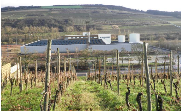
Die geplante Kläranlage in Grevenmacher