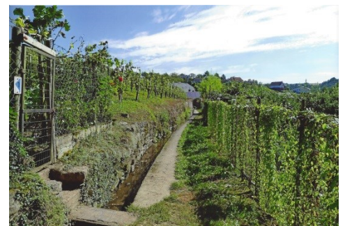
3. Präis Gaby Thill