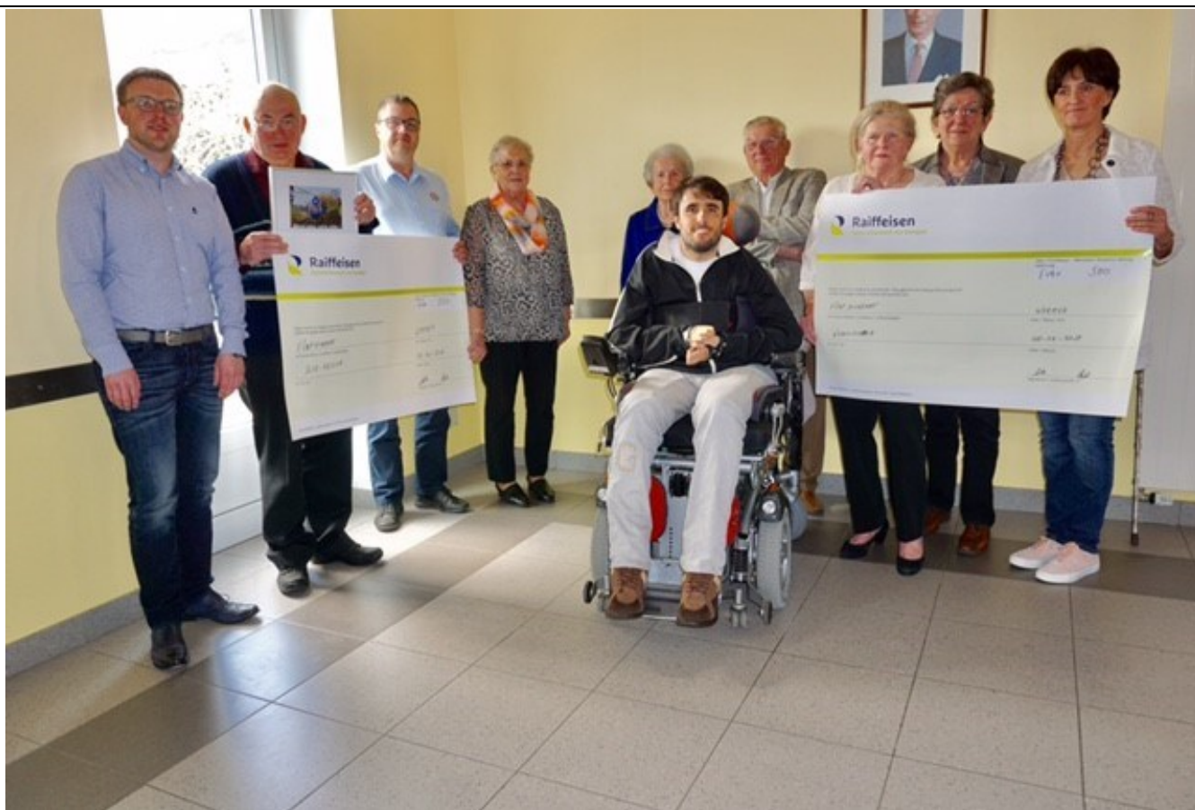
Den 3ten Alter vun der Rieslingsgemeen huet jeeeweils en Don vu 500,00 € un d'Associatiounen Air Rescue a Wonschstär gespent.