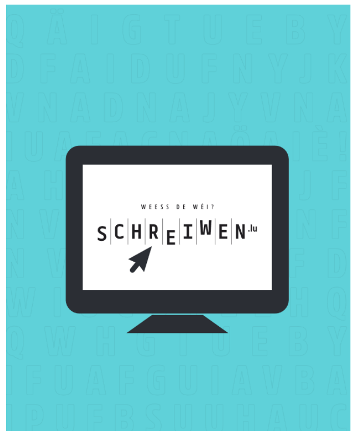
Brochuren sinn disponibel an der Entrée vun der Gemeen zu Wormer.