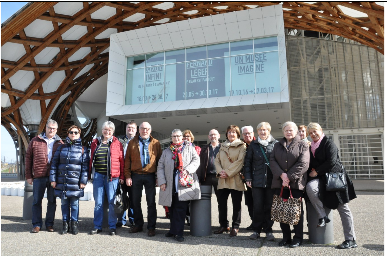
D'Kulturkommissioun vun der Wormer Gemeen op hirer Kulturreess op Metz.