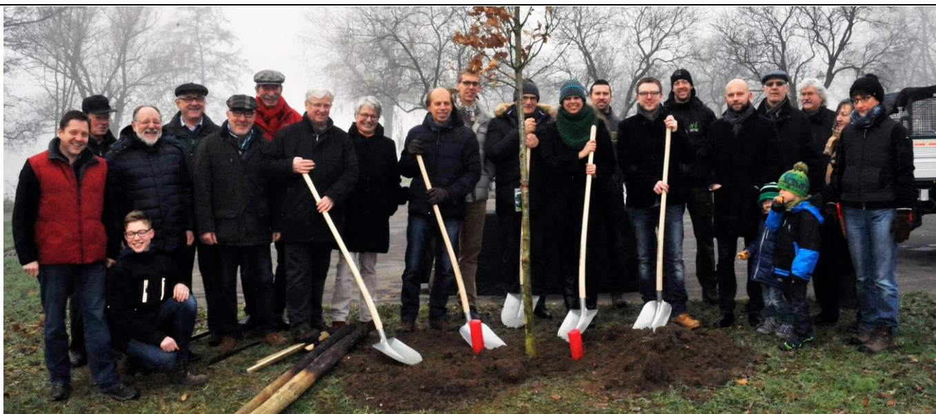
D'Wormer Gemeen huet zesumme mat der biologescher Statioun vum SIAS an der Naturverwaltung Beem an der "Rue de Dreiborn" zu Wormer an am Puddel zu Éinen (Eechen-Solitärs) geplantz. Zu dësem Ulass war och d'Ëmweltministesch Carole Dieschbourg op Éinen komm.