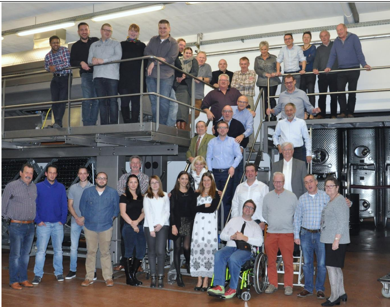
112 Joer Wormer Pompjeeën goufen am Domaine Schumacher-Lethal et Fils zu Wormer gefeiert.