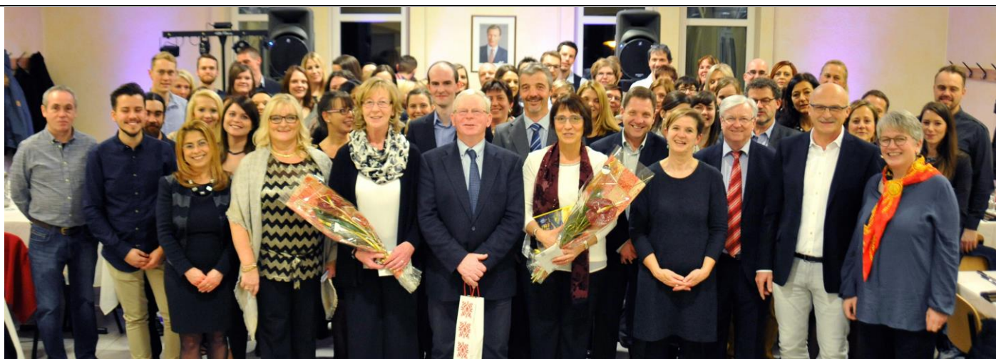
Joeresennfeier vum Schoulsyndikat Billek vun Dräibuer am Centre culturel zu Beyren.