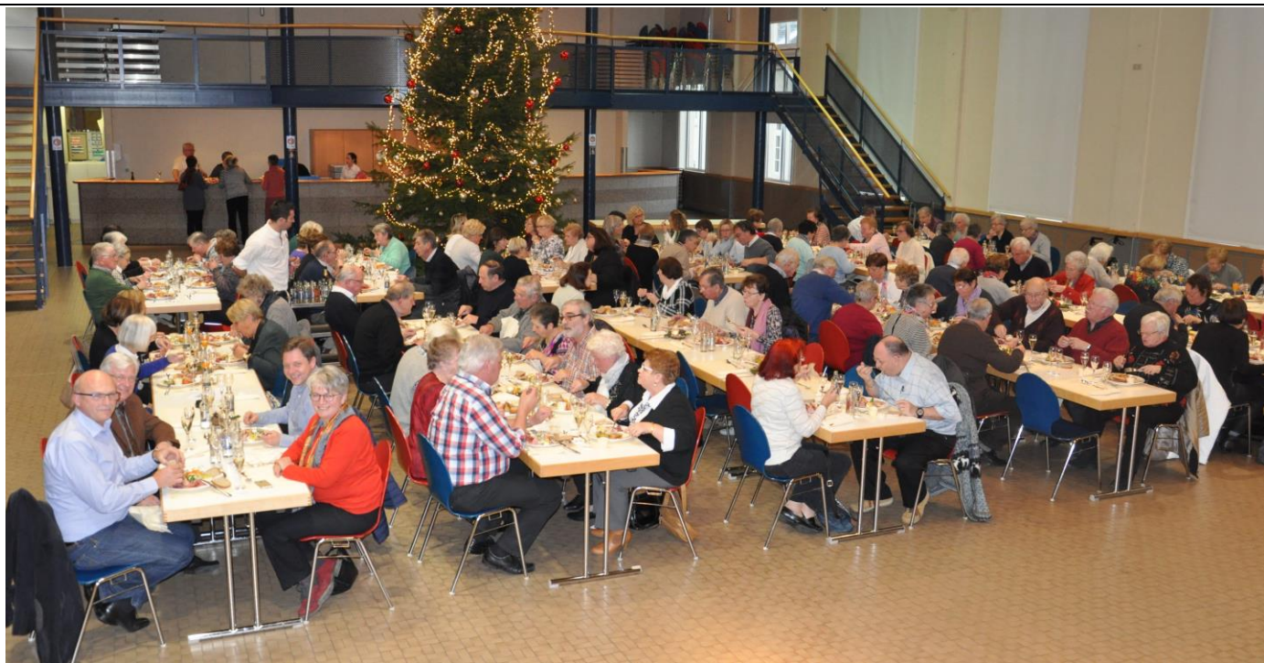
Den 10. Dezember 2016 huet d'Kommissioun vum 3ten Alter zesumme mam Schäfferot eng Seniorefeier am Centre culturel zu Wormer organiséiert.