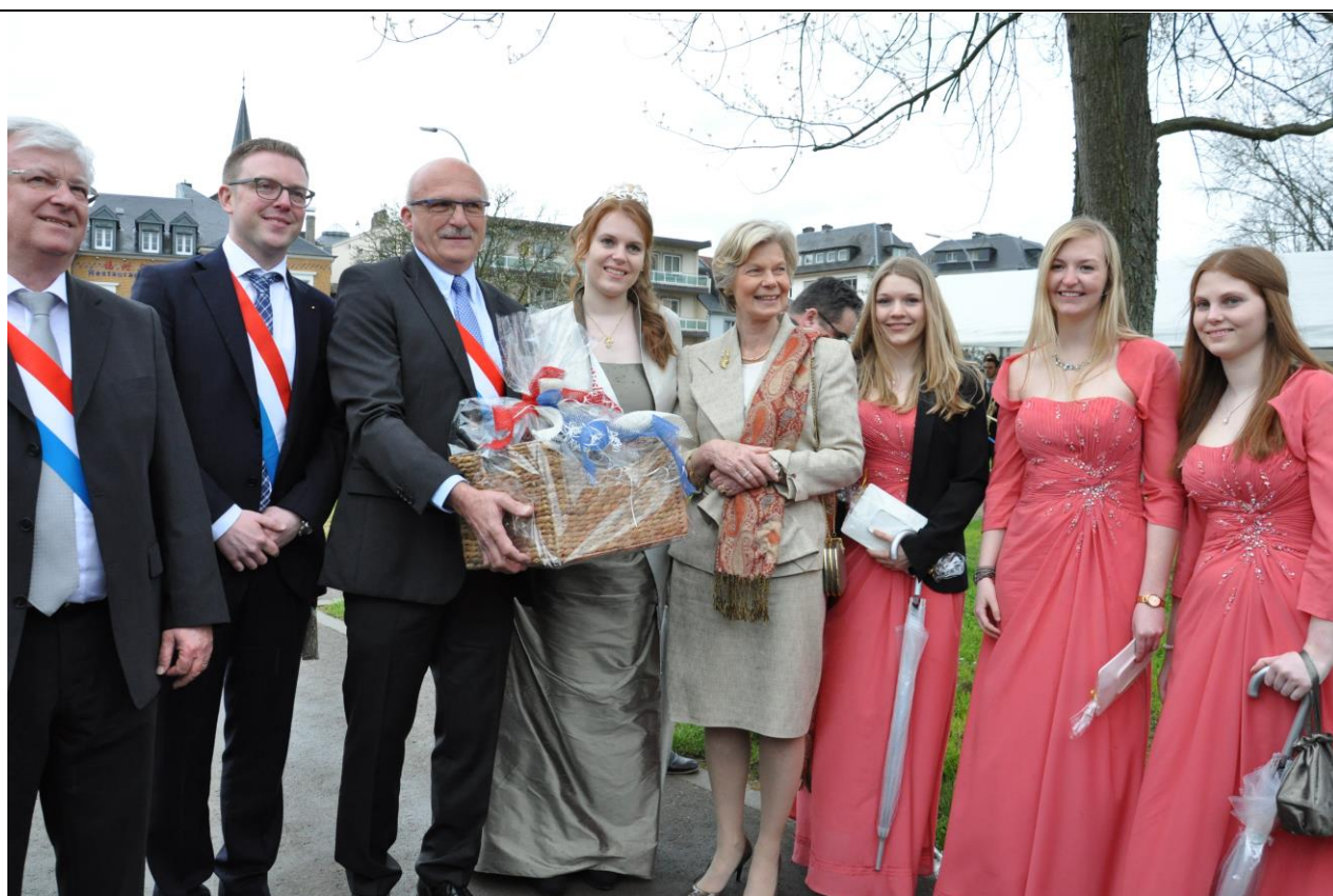
De Schäfferot an d'Rieslingskinnigin mat senge Prinzessinnen hunn der Prinzessin Marie-Astrid e Cadeau am Kader vun der 50-Joer-Feier vum Schëff Princesse Marie-Astrid iwwerreicht.